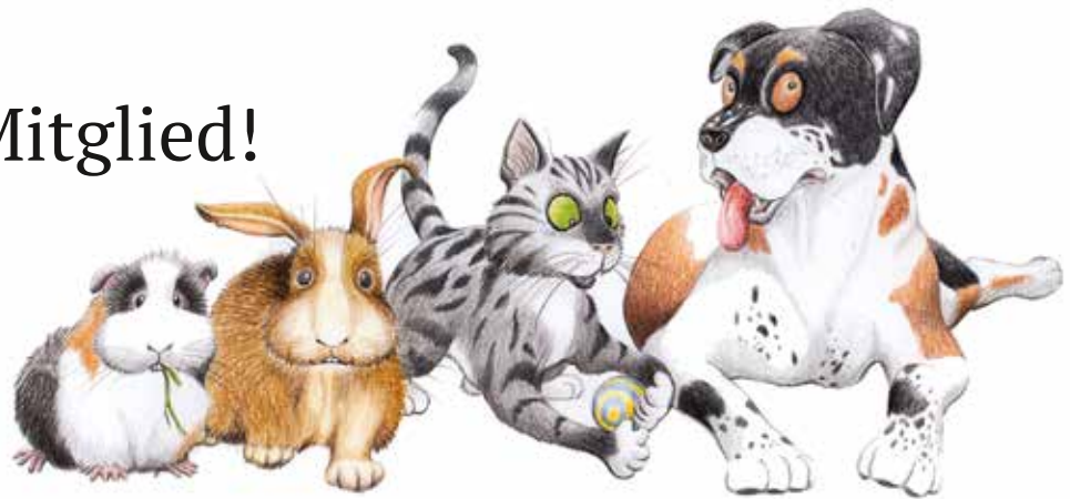
Illustration: Andrea Tändler